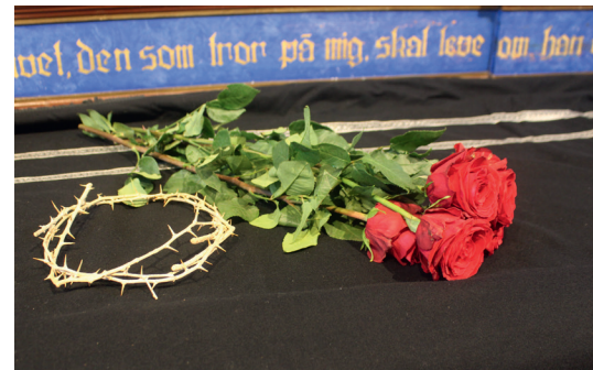
De fem røde rosene symboliserer Jesu lidelse og sår, og tornekronen gav romerne ham for å gjøre narr av at han kalte seg jødernes konge.

Langfredag er kirkas eneste virkelige sørgedag. Stemningen i kirka er stille og alvorspreget, det som preger gudstjenesten denne dagen er den lange lesningen av Jesu lidelseshistorie. Fra gammelt av har gudstjenesten langfredag vært uten klokkeringing og orgel, og på det avkledd alteret ligger et svart klede med fem røde roser som symboliserer Jesu lidelse og sår.